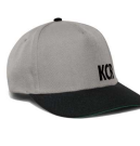
Flatback-Cap KCR 14,95 €