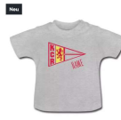
Kinder-Shirt mit Individualisiertem Namen 19,95 €